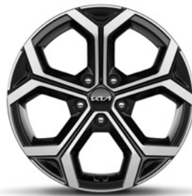
18-Zoll-Leichtmetallfelgen (Serie für Plug & Ride und Spirit)