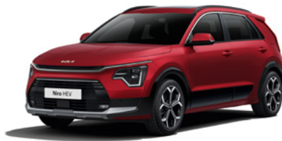
Runway Rot Metallic (CR5)

Bei einigen unserer modernen Metallicfarben werden bewusst unterschiedliche Farbpigmente verwendet. Dadurch können unter bestimmten Lichtverhältnissen, z. B. direktes Sonnenlicht, attraktive Farbeffekte erzielt werden. Zum Teil kann die Farbe changieren, z. B. von Schwarz zu Dunkelblau. Bei den hier abgebildeten Farbdarstellungen kann es aufgrund der Drucktechnik zu Abweichungen zu den Originalfarben kommen. Weitere Informationen zu den Farbeffekten und Grundfarben erhältst du bei deinem Kia-Partner. Metalllackierungen sind aufpreispflichtig.