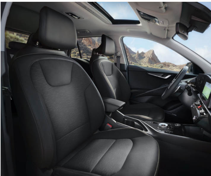
Sitzbezüge in hochwertiger Ledernachbildung, Charcoal (CCV) (Plug & Ride und Spirit)