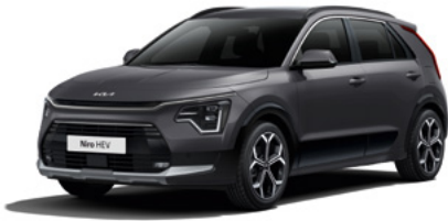
Interstellar Grau Metallic (AGT)