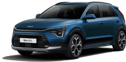
Mineralblau Metallic (M4B)