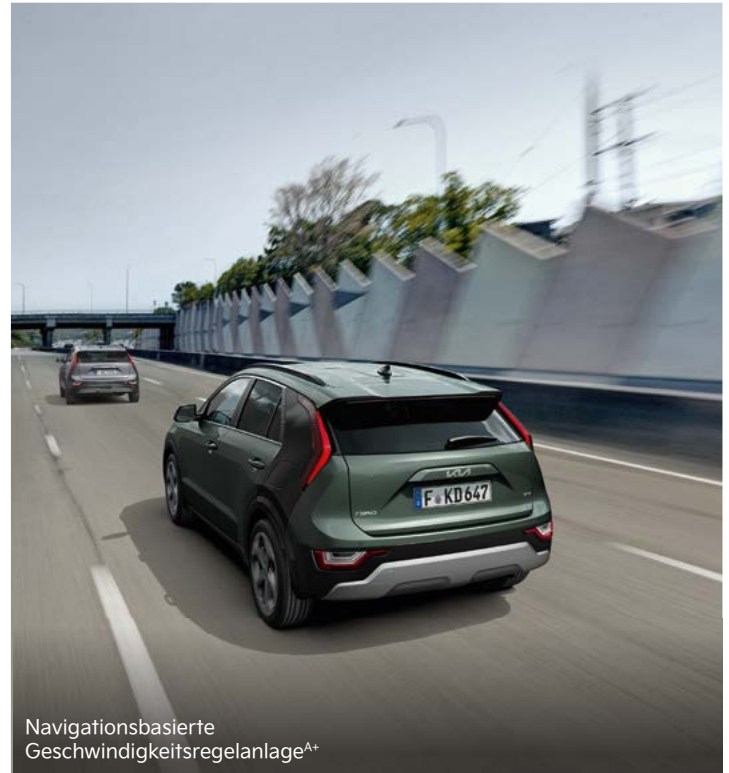
Navigationsbasierte Geschwindigkeitsregelanlage A+

Zusätzliche Sicherheit beim Zurücksetzen aus Parklücken oder langsamem Manövrieren im Rückwärtsgang: Der Kollisionsvermeidungsassistent (Parking Collision-Avoidance Assist, PCA) registriert mit Unterstützung der Rückfahrkamera sowie der hinteren Ultraschallsensoren, ob sich Fußgänger